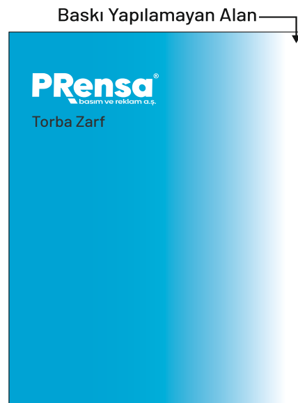
GEÇİŞLİ ZEMİN BASKILI